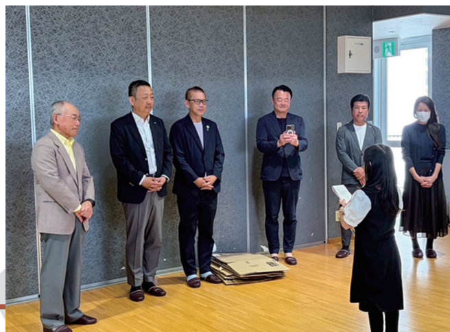
5月2日(金) <エスペランス四日市慰問>