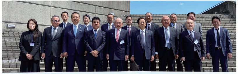
Rotary D2630 国際ロータリー第2630地区 クラブ・リーダーシップ・ラーニングセミナー 2025 不二羽島