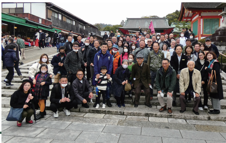
11月20日(日) <秋の家族会> 「創業250年 京都伏見老舗料亭のご昼食と伏見稲荷」