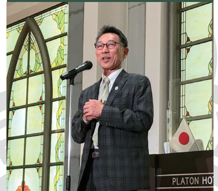
藤牧会長エレクトによる R情報ミーティング中締め挨拶