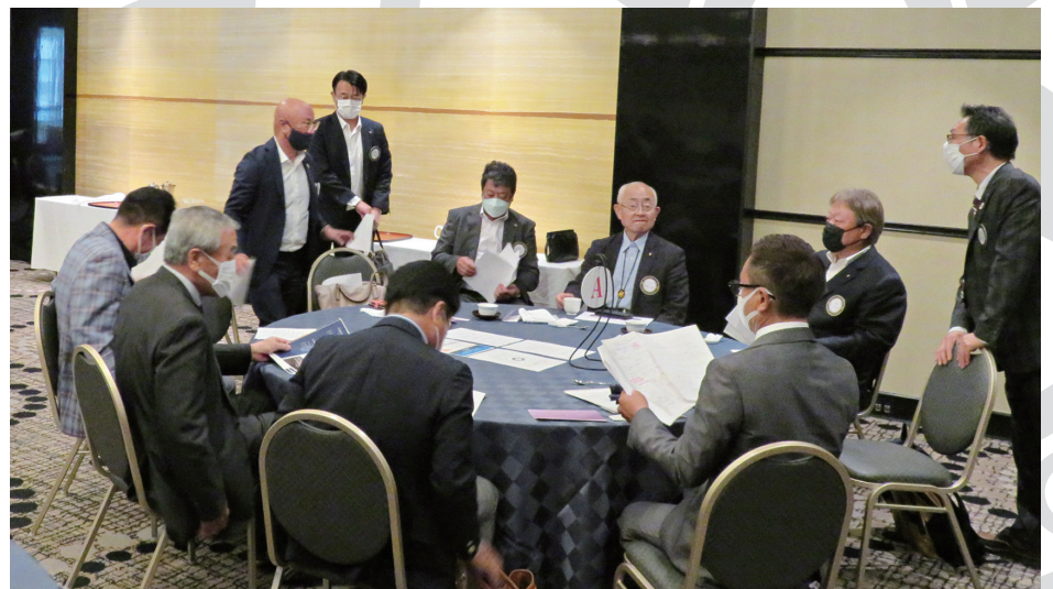
右写真：次年度委員会合同研修会 (2022年5月27日撮影)