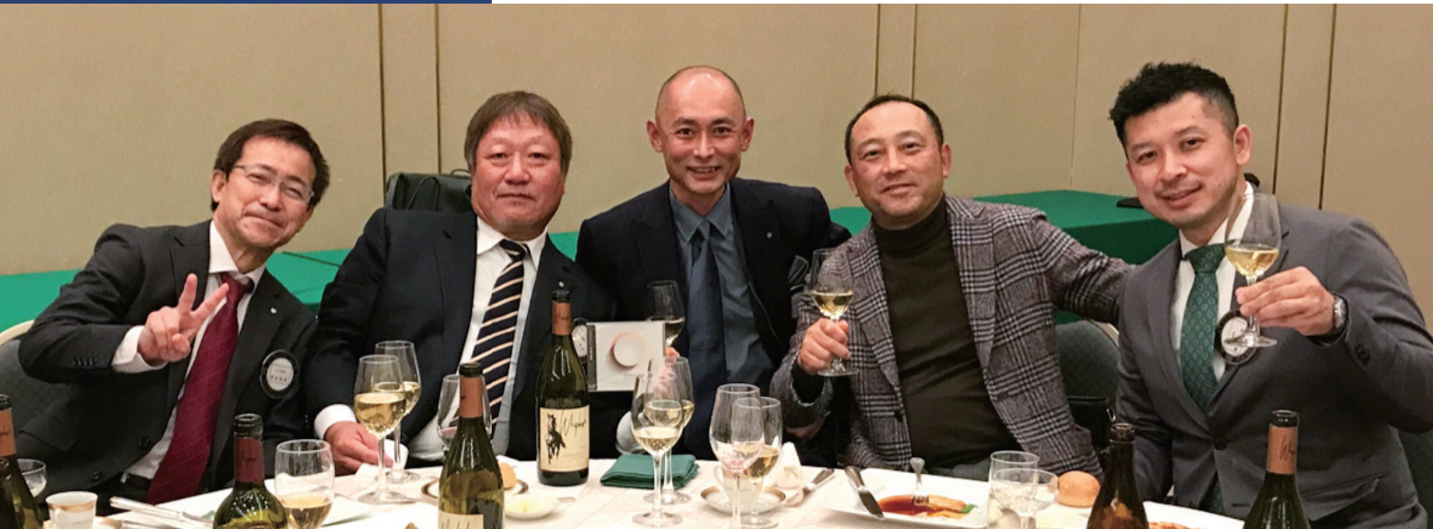
上写真：年末友愛例会より