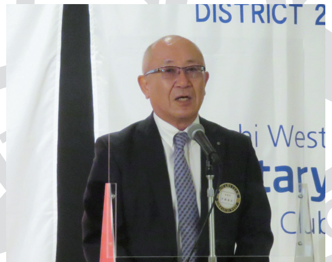
右写真：ミニ卓話より