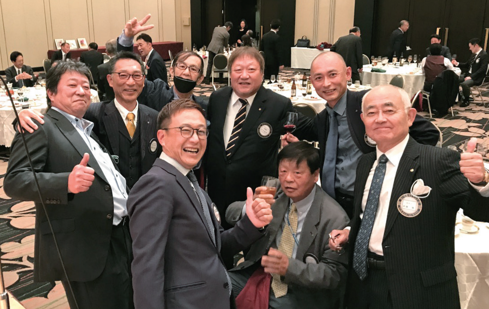
上写真：年末友愛例会より