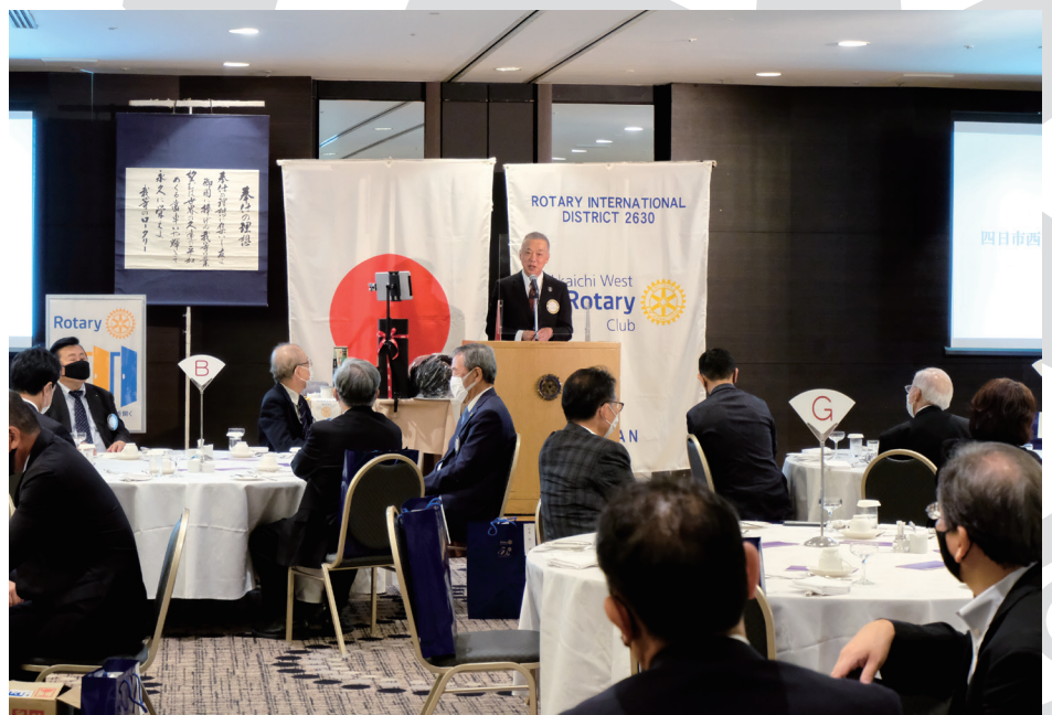
右写真・大矢知会長退任挨拶の様子

その他・・・①四日市5ロータリークラブ親睦ゴルフ大会登録料(個人負担分)と結果について ②通常例会(昼食)における料理単価の改定について 報告事項・・・①第44回インターアクト年次大会リモート開催の件 ②地区大会記念品発送のご案内について